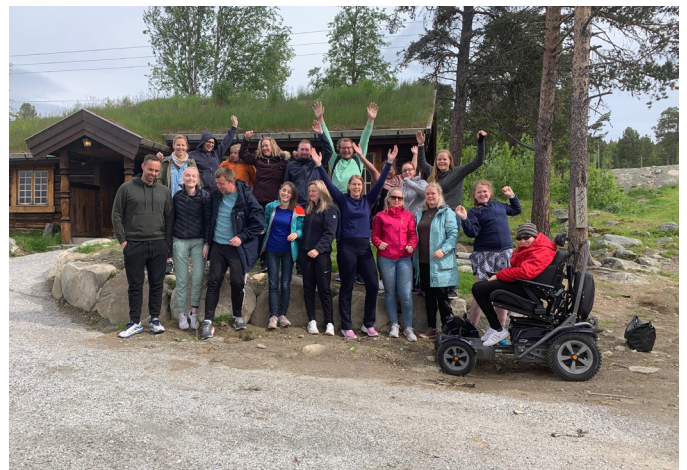
Deltagere på Felles Start 2019.