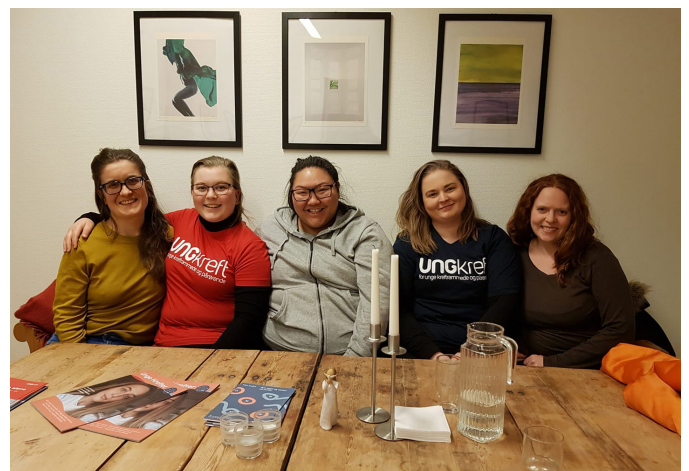
Ung Kreft Vestfold, Buskerud og Telemark på styremøte.