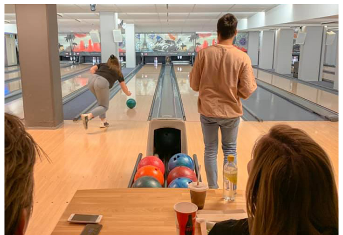
Bowlingkveld med Oslo og Akershus.