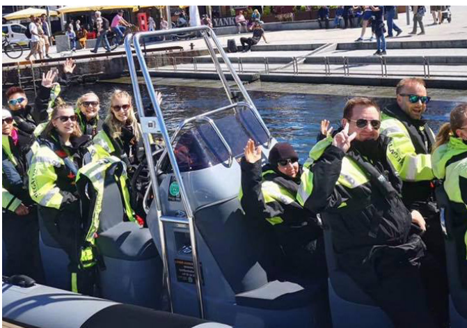
Ribtur med Ung Kreft Rogaland.