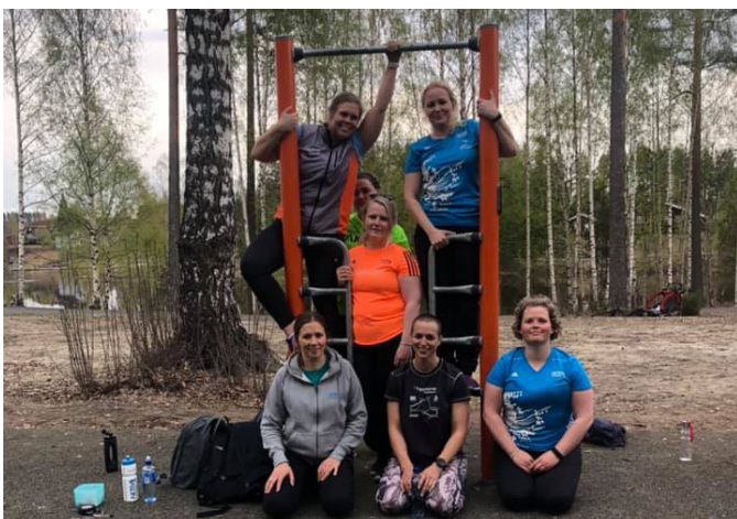
Utetrening med Sjukt Sprek Elverum.