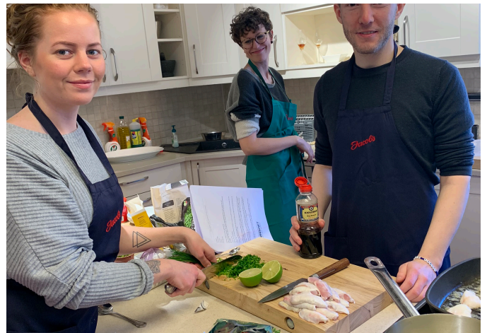
Matkurs med Oslo og Akershus.