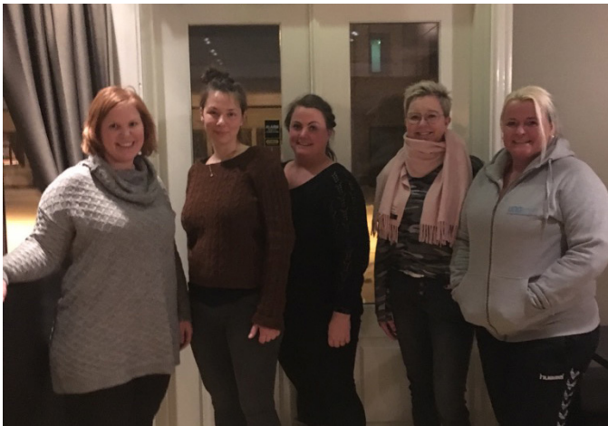
Ung Kreft Innlandet sitt styre.