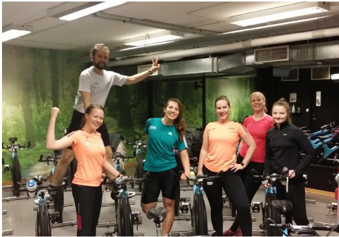
En Sjukt Sprek gjeng i Oslo.