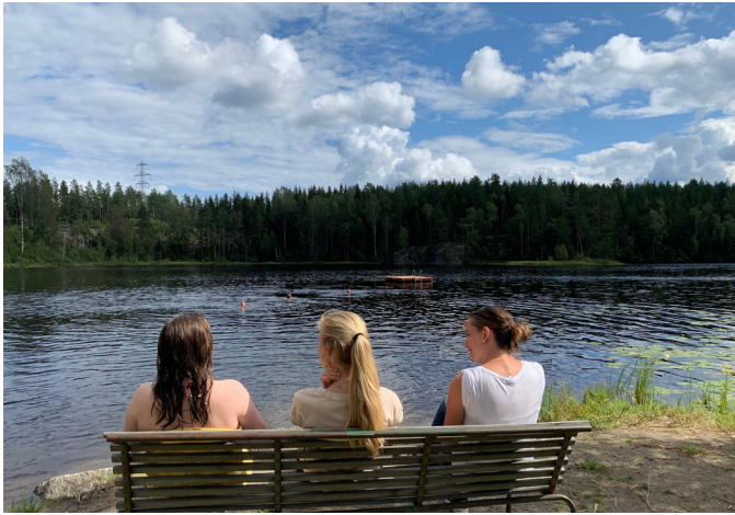
Gode samtaler på sommerleir.