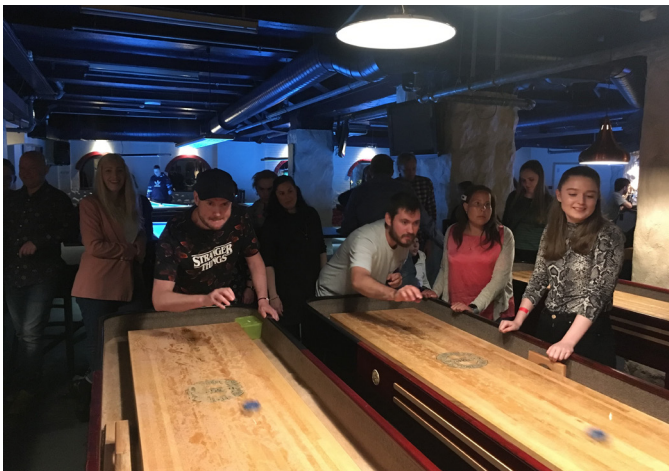
Sommeravslutning med Ung Kreft Vestland.