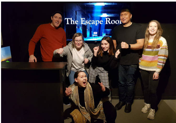
Full fart på Escape Room i Vestfold, Buskerud og Telemark.