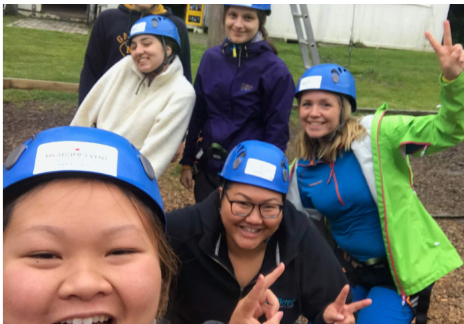
Moro på sommerleir for unge pårørende og etterlatte 2019.