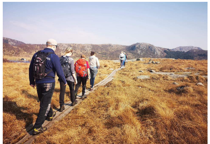
Tur i fjellet med Ung Kreft Vestland.