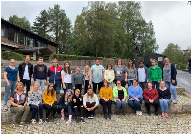
Deltagere på sommerleir for pårørende og etterlatte.