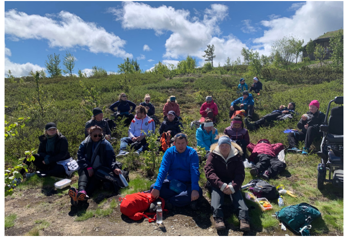
Lunsjpause på Felles Start 2019.