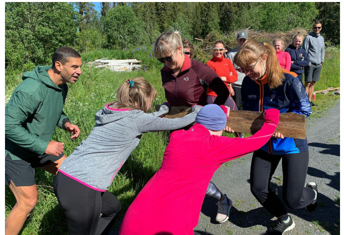
Full fart på Sommeraktivitetsuka på Montebellosenteret.