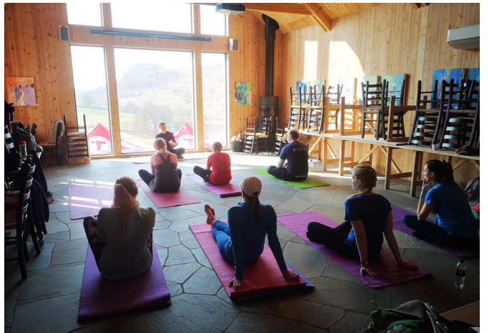
Yoga med Sjukt Sprek Stavanger.