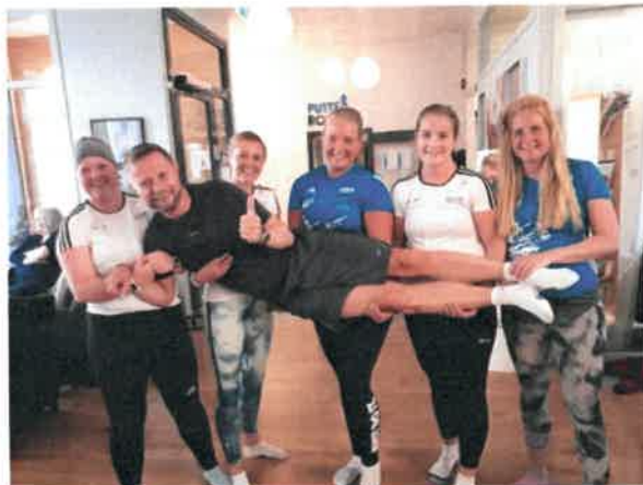
Helseminister Bent Høie på besøk hos Sjukt Spret Trondheim