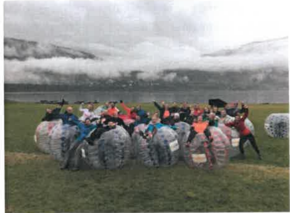
Sjukt Spret på Felles Årsmål 2017 på Voss

Sjukt Spret Oslo trener to ganger i uken, og er veldig fornøyd med det. Det er spinning hver mandag og styrke på onsdager. Sommeren 2017 mistet de sine faste lokaler hos SiO Athletica og har fortsatt utfordring med å finne et fast sted. Per dags dato trener de på Friskis&Svettis på mandager og Tøyen Aktivitetshus k1 på onsdager.