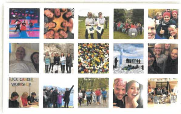
Collage fra Instagramkontoen vår

Ung Kreft er en ungdomsorganisasjon, og derfor er sosiale medier viktig for oss. Vi bruker tre plattformer i sosiale medier: Facebook, Instagram og Twitter. På Facebook deler vi relevante saker fra Ung Kreft og kreftmiljøet, på Instagram viser vi frem hva som skjer i organisasjonen rundt omkring i landet, mens Twitter er en mer politisk kanal. I denne perioden har vi opplevd vekst i alle våre kanaler i sosiale medier.