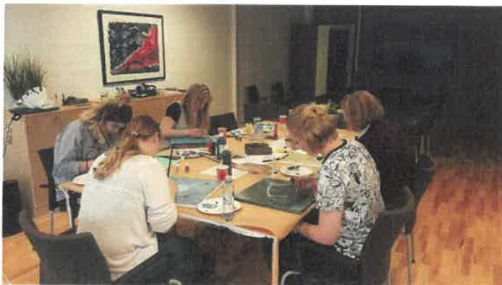
Målekveld hos Ung Pårørende Tromsø

Ung Pårørende Oslo fikk nye samlingsledere sommeren 2017. Gruppen er godt drevet, og de jobber kontinuerlig med å få interessante samlinger som trekker deltagere.